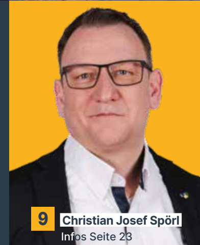
9 Christian Josef Spörl Infos Seite 23