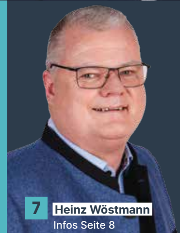
7 Heinz Wöstmann Infos Seite 8